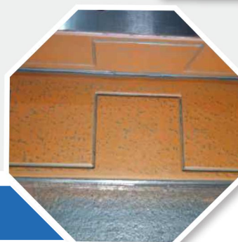
精密スクラップ処理 Precise scrapping